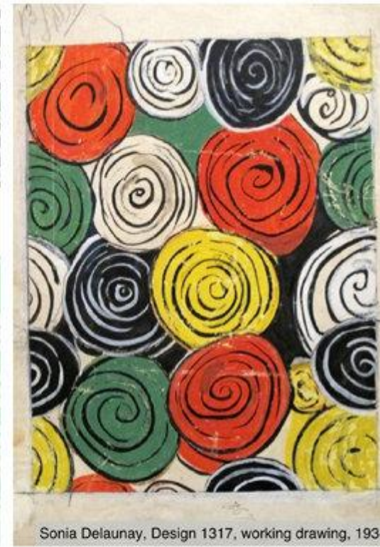
Sonia Delaunay, Design 1317, working drawing, 1934