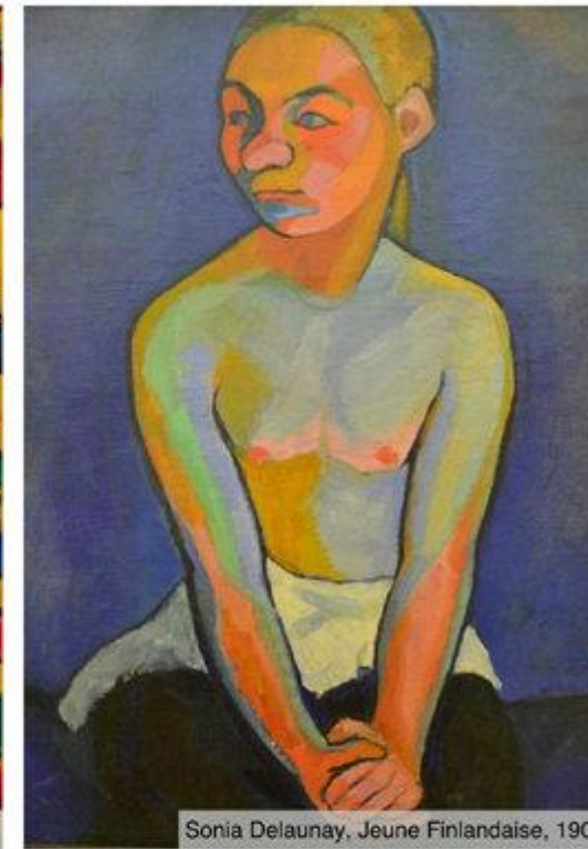
Sonia Delaunay, Jeune Finlandaise, 1907