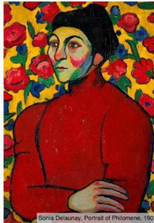
Sonia Delaunay, Portrait of Philomene, 1907