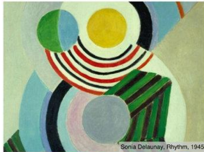
Sonia Delaunay, Rhythm, 1945