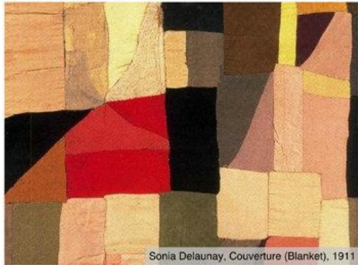
Sonia Delaunay, Couverture (Blanket), 1911