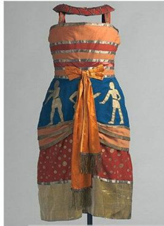
Sonia Delaunay, costume for the Ballets Russes