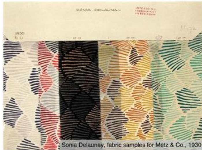
Sonia Delaunay, fabric samples for Metz & Co., 1930