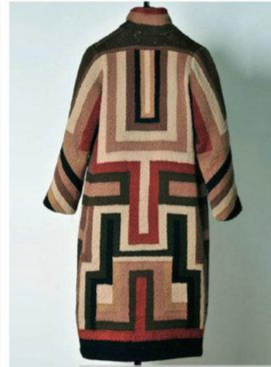
Sonia Delaunay, Coat for Gloria Swanson