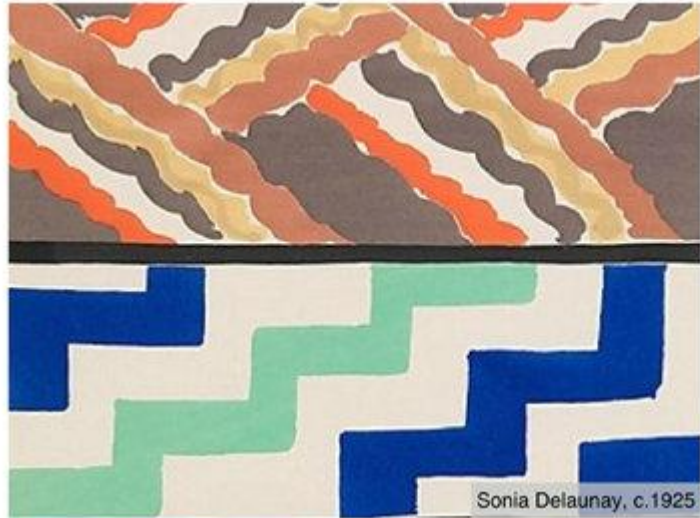
Sonia Delaunay, c.1925