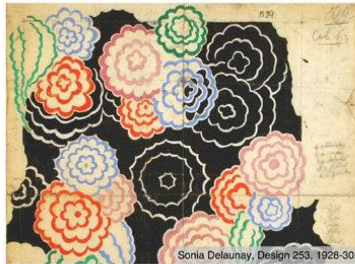
Sonia Delaunay, Design 253, 1928-30