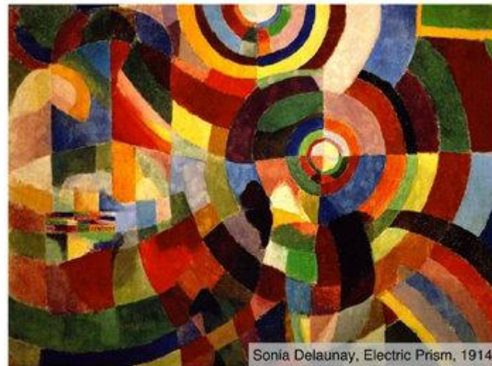
Sonia Delaunay, Electric Prism, 1914